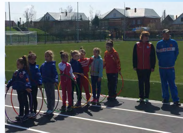
Открытие стадиона в п. Капельница