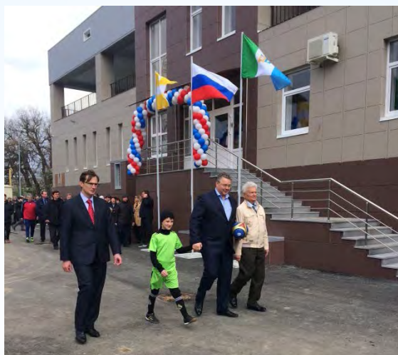
Открытие стадиона «Спартак»