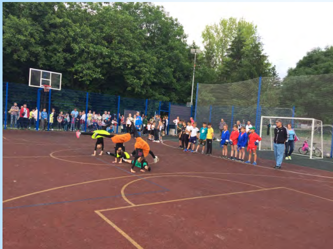
Открытие многофункциональной спортивной площадки