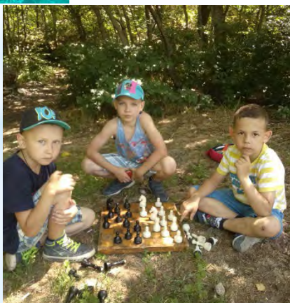
Походы. Гора «Железная»