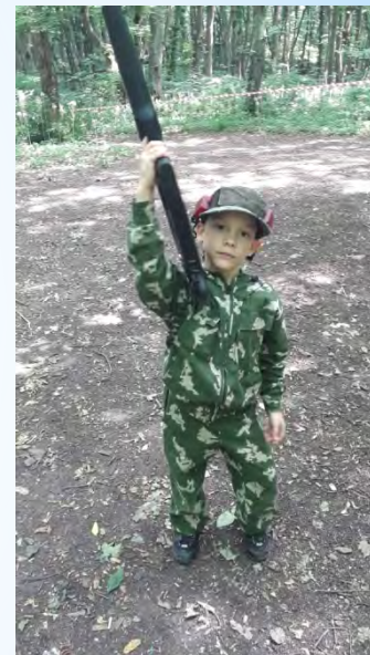
Открытие лагерной смены Игра «Лазертаг»