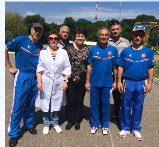
1 июня – День защиты детей