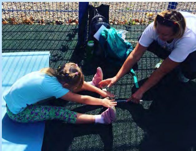
День города-курорта Железноводска