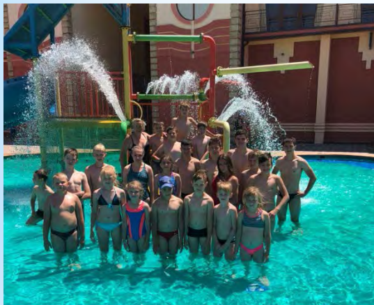
Поход в аквапарк